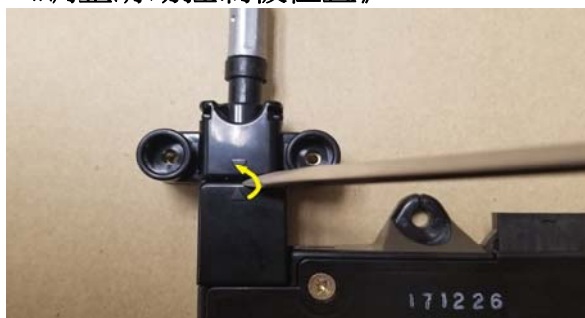
用平头螺丝打开盖子