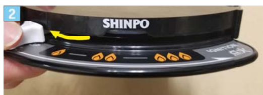
将调节钮滑动到“止”位置