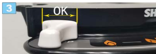
调节钮必须在此位置中间