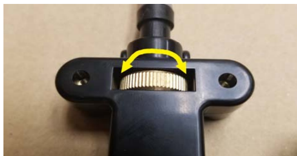
调整金属时，火力调节钮的位置会移动。 检查后关闭盖子