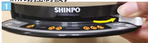
将调节钮滑动到“点火”位置