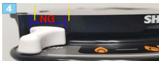
如果没有将调节钮保持在中间位置，点火时可能会出现问题